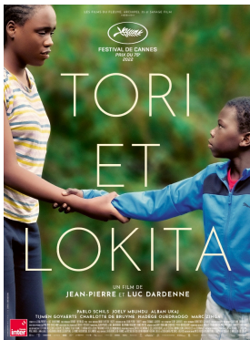
Tori et Lokita

Pékin. Ce documentaire nous montre les différentes phases de construction d'une équipe qui a dominé le water-polo pendant une dizaine d'années sans rivalité ou presque. Les succès de la Hongrie par des séquences alternant entre images d'archives et témoignages face caméra d'anciens joueurs ou d'entraîneurs qui ont joué dans l'équipe de Dénes Kemény ou qui l'ont affronté. Bien que le sujet soit intéressant, notamment pour des Français qui n'y connaissent pas grand-chose en water-polo, on peut regretter la longueur du film, qui dure 2h20, longueur due à la narration, qui est toujours la même à chaque olympiade (équipe en difficulté qui parvient à se ressouder pour gagner le titre olympique). Ceux qui ont pu voir des documentaires américains sur certaines chaînes de TNT françaises pourront aussi reconnaître le témoignage face caméra "à l'américaine". Un ton bourrin et parfois vulgaire pour parler des matchs, qui peut faire rire au début, mais qui fatigue au bout de deux heures. On pourra aussi regretter le sous-titrage français du film, incompréhensible, certaines phrases n'ayant pas de sens.